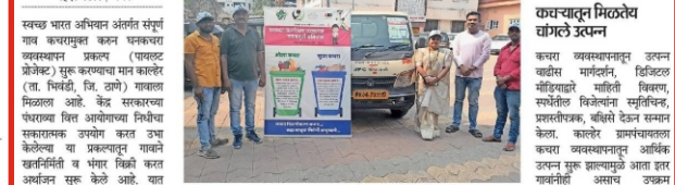
आल व सुभा कचरा वर्गीकरणवातत जनजागृती करताना 'सेल्फ केअर'चे सदस्य.

काश विलगीकरण कचऱ्याचे, उत्पन्न वाढवा गावाचे