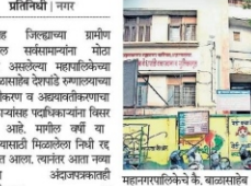
महानगरपालिकेचे के. बाबरासंबि देवाराडे रुग्णालय.

प्रतिनिधी | नगर अन्विंकुत गॅस विनिर्जिन घेतकर कावयावयान जना कचऱ्या आलेल्या गॅस टाव्या तोफखान्यात उघडयते येणुतु अन्विकावणी घडतत पडतु आलें. पुवटा विभागकडे वॉकपर पत्रजुस करणीची या टाव्या सल्लेने ताल्क चेतव्या नाही. त्यामुळे पॅरिंसारत या टाव्या सल्लय्याची केळ आली आहे. धरगुणी गॅसचा सल्ले गैवारा होत असताना, वातत कावयाळ करवणी उघडवती अंतर्ज्ञतया पुवटा विभागाकडु कंविचतत कारासं होत. धरगुणी गॅसचा सल्ले गैवारा होत असताना, वातत कावयाळ करवणी उघडवती अंतर्ज्ञतया पुवटा विभागाकडु कंविचतत कारासं होत.